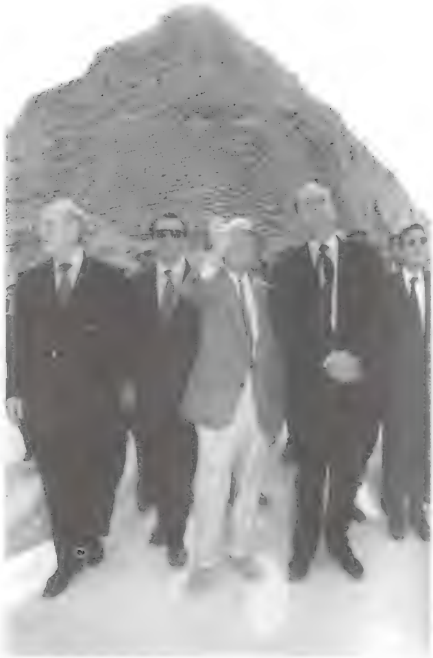
لوير يشرح آثار سقارة للرئيس جاك شيراك